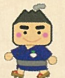
まち歩きキャラクターぶらり君