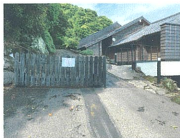
②右に曲がり施設の脇をお進みください