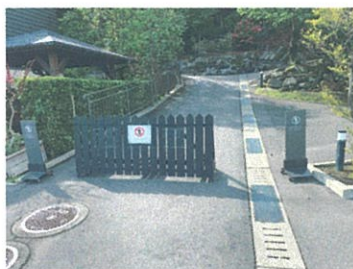
①坂をのぼって右折してください