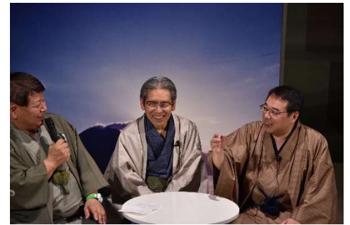
維新ふるさと館を活用した新春寄席