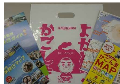
パンフレット等の印刷物