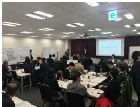
DMO設立準備ワーキンググループ