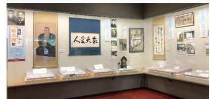
「西郷どんと菊次郎」展