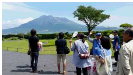
まち歩き参加者を案内するボランティアガイド