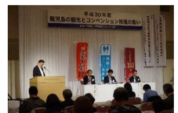
3市によるトークセッション

第2部は、役員や賛助会員及び観光ボランティアガイド相互の親睦や情報交換を行う交流会を開催した。