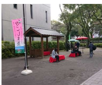
お茶のおもてなし(西郷誕生地)