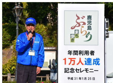
1万人達成記念セレモニー