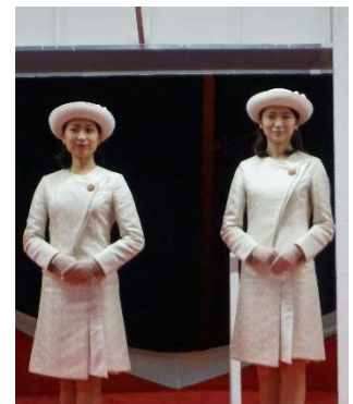
第14代かごしま親善大使