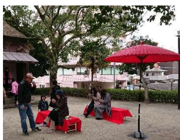
お茶のおもてなし(武家屋敷)