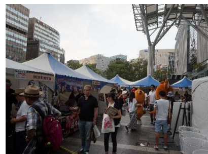
よかとこ鹿児島フェスタの様子