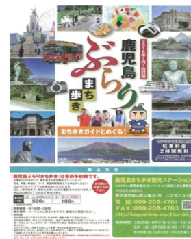
鹿児島ぶらりまち歩きリーフレット