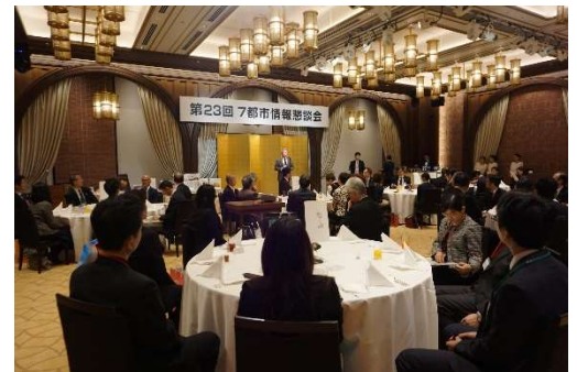
第23回7都市情報懇談会