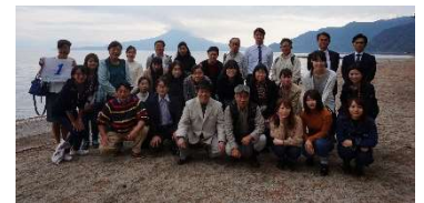
観光地視察研修（写真は重富海岸）