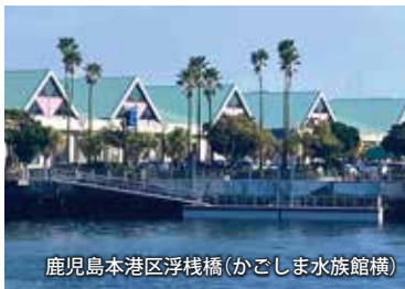
鹿児島本港区浮桟橋(かごしま水族館横)