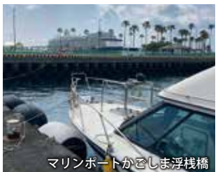
マリポートかごしま浮桟橋