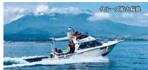
クルーズ船と桜島

※隼人新港 → JR 隼人駅 (タクシーで 10 分) ※JR 隼人駅 → JR 鹿児島駅 (「特急きりしま」で約 30 分) ※JR 鹿児島駅 → 本港区 (徒歩 10 分) ☆隼人新港でタクシーのご依頼がある場合は、ご予約時 にお申し出ください。