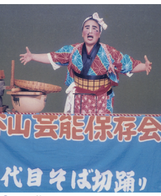
7ソバ切り踊り (谷山芸能保存会)

伝統芸能の披露 12:30~13:30の間に センテラススクエアで披露 します。