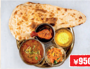
Tandoori Chicken Curry Set タンドリーチキンカレーセット ¥950