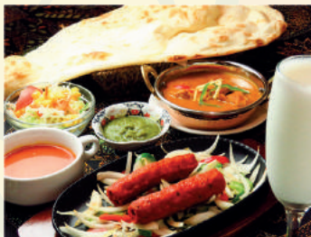
Shik Kabab Course シークカバブコース ¥1500