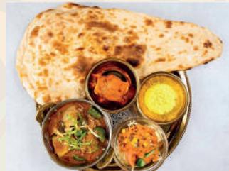
Chicken Tikka Curry Set チキンティッカカレーセット ¥950