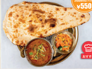
Nan or Rice Curry Set ナン/ライスカレーセット ¥750