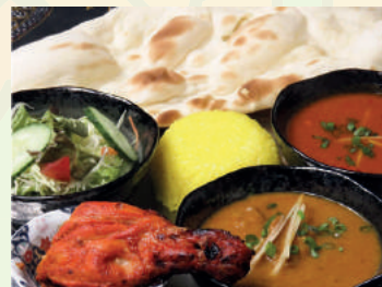
Meat Thali Set ミートタリセット ¥1,200