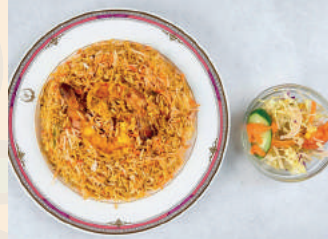
Mutton or Prawn Biryani マトン/エビビリヤニ ¥1,100