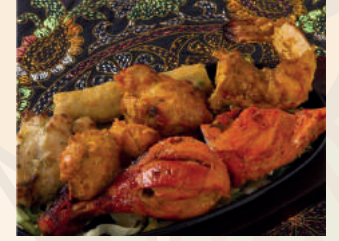
Mix Grill ミックスグリル ¥1,500

セットカレーではお好みのカレーを下記より1つお選びください / Choose 1 curry from 6