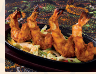
Tandoori Prawn タンドリーエビ ¥1,100 ハーフ ¥600