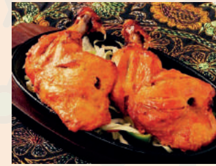
Tandoori Chicken タンドリーチキン ¥900 ハーフ ¥500