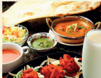
Chicken Tikka Course チキンティッカコース ¥1,500