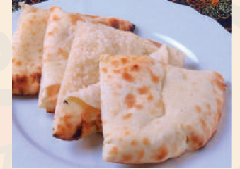
Coconut Honey Nan ココナッツハニーナン ¥450