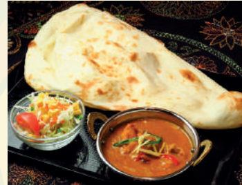
Nan or Rice Set ナン/ライスセット ¥800