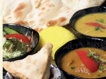
Veg Thali Set ベジタリセット ¥1200