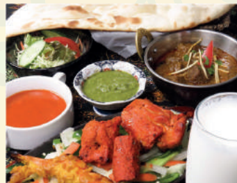
Mix Grill Course ミックスグリルコース ¥1,650