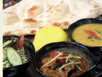
Mutton Set マトンセット ¥1,300