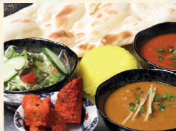
Kabab Set カバブセット ¥1,100