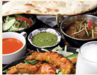
Tandoori Prawn Course タンドリーエビコース ¥1,650