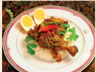
Chicken Roast Curry Set チキンローストカレーセット ¥1,100