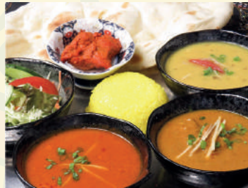
All you can eat Set 食べ放題セット ¥1,300