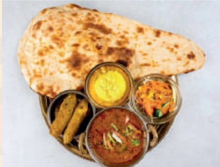
Seekh Kabab Curry Set シーケバブカレーセット ¥950