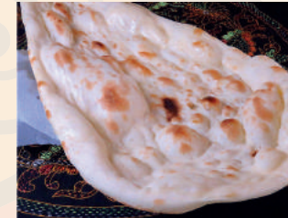
Nan ナン ¥300