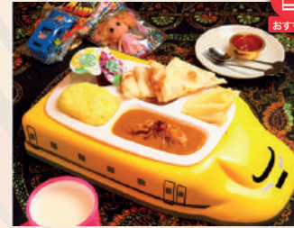
Kids (A/B/C) Set キッズ(A/B/C)セット ¥600