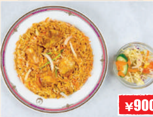
Chicken Biryani or Veg Biryani チキンビリヤニ/ベジビリヤニ ¥900