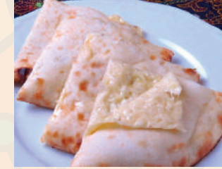
Cheese Nan チーズナン ¥450