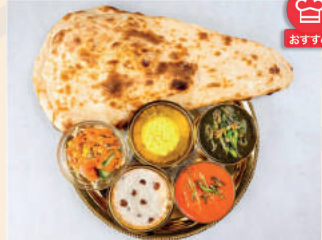
Ladies Set レディースセット ¥1,100