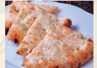
Garlic Nan ガーリックナン ¥450