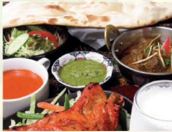
Tandoori Chicken Course タンドリーチキンコース ¥1,500