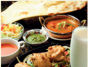
Malai Tikka Course マライティッカコース ¥1,500