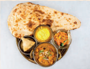
Veg Lunch ベジランチ ¥950