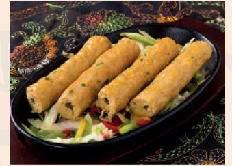
Shik Kabab シーケカバブ ¥900 ハーフ ¥500