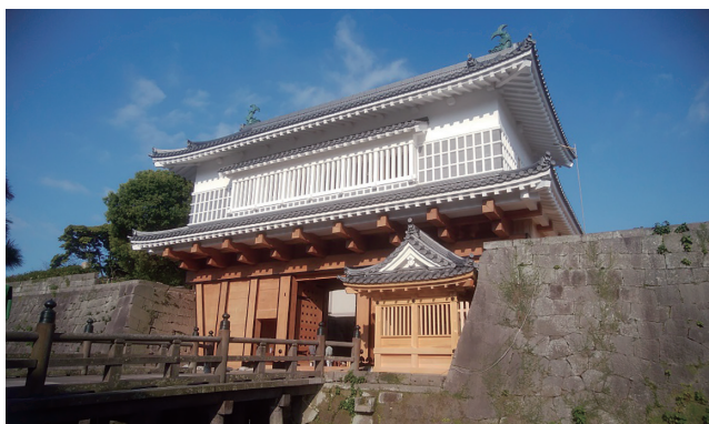
3月完成予定の鹿児島城本丸「御楼門」

3月に完成する鹿児島城本丸「御楼門」を中心に巡るオプションコースもあり、鹿児島の新スポットもお楽しみいただけます。