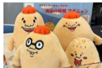
『火山の妖精“マグニオン”』

鹿児島市のPRキャラクター『火山の妖精“マグニオン”のぬいぐるみ』や、開催地PR用グッズ『法被』をお貸出いたします