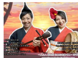
島唄と楽しいトーク