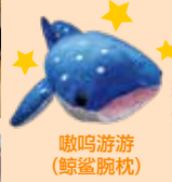
嗷呜游游 (鲸鲨腕枕)