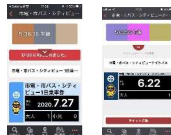
【スマホー日乗車券】