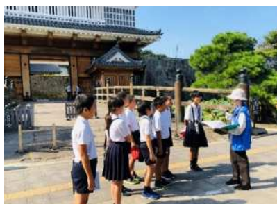
▶ 修学旅行の班別学習でも大人気