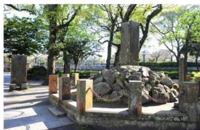
▲ 生家跡(西郷隆盛・従道誕生地)