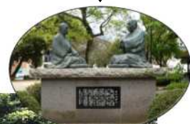
徳の交わり (西郷隆盛と菅実秀の座像)