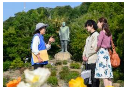
▶ 郷土の偉人の思いや人柄をもっと身近に