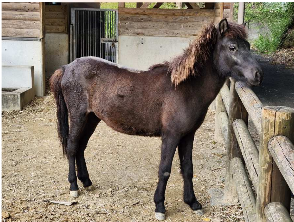
写真：トカラウマ