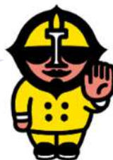
交通局マスコットキャラクター バスでん仮面

専用アプリをダウンロードしたスマートフォンなどで各乗車券を購入し、市電・市バス降車時に乗車券画面を乗務員へ提示してください。