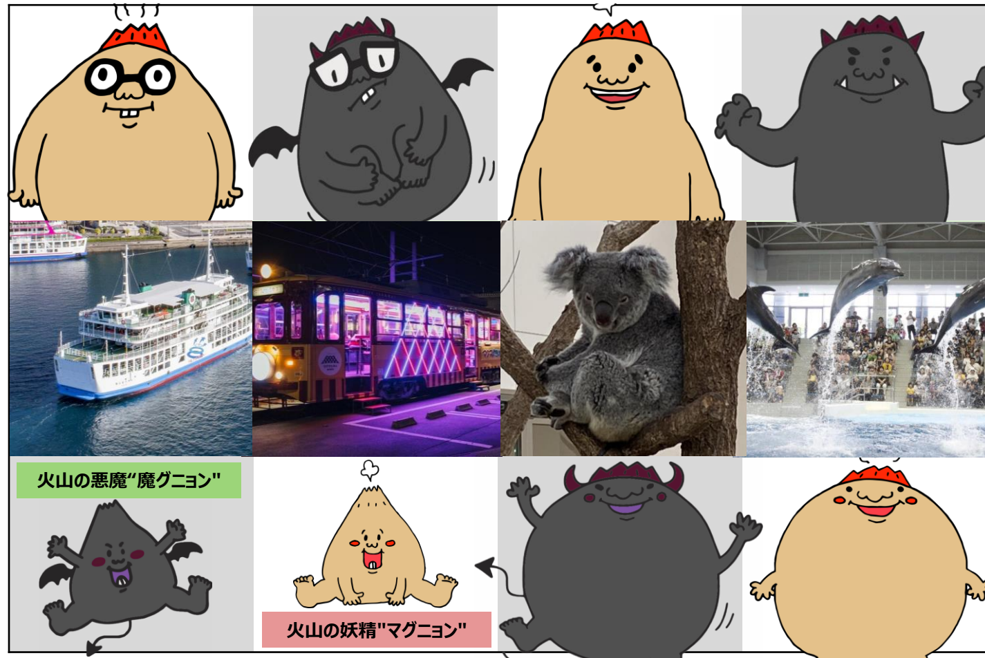
火山の悪魔"魔グニオン"