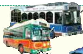
复古式路面电车巴士

※8月、12月、1月的每个周五都运行。 ※5月3日-5日、8月13日-15日也运行。 ※仅在12月增加18:30, 19:30两个班次。 ※鹿儿岛锦江湾夏夜大花火大会当日将停开。 ※按季节可增加班次。